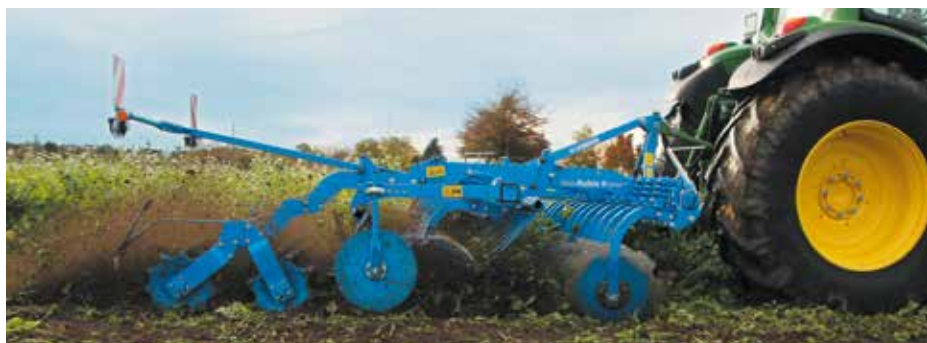
Сплошное и интенсивное перемешивание